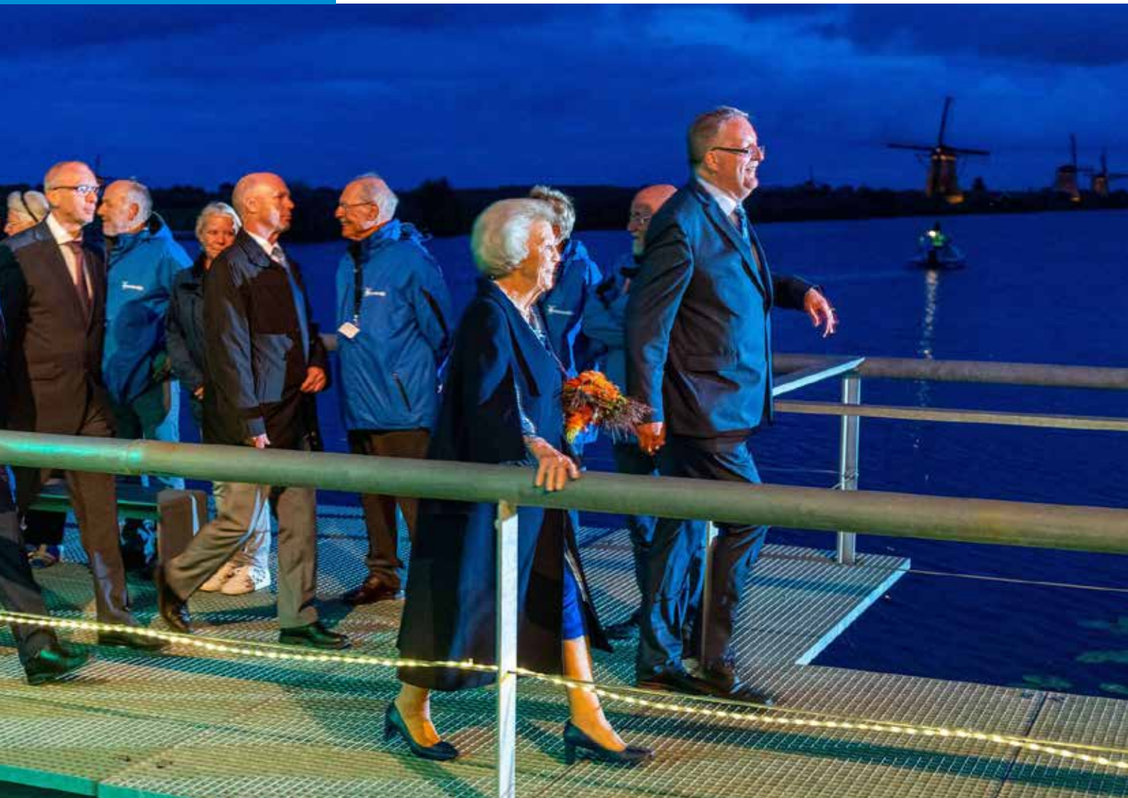
↑ Koninklijke Hoogheid Prinses Beatrix der Nederlanden op de brug met directeur Cees van der Vliet.

Met een druk op de knop heeft Koninklijke Hoogheid Prinses Beatrix der Nederlanden op zaterdag 7 september 2019 het nieuwe bezoekerscentrum geopend in UNESCO Werelderfgoed Molencomplex Kinderdijk -Elshout . Dat gebeurde tijdens een spectaculaire show vol muziek, fontein en licht. De voorzitter van Stichting Werelderfgoed Nederland was de ceremoniemeester tijdens de opening.