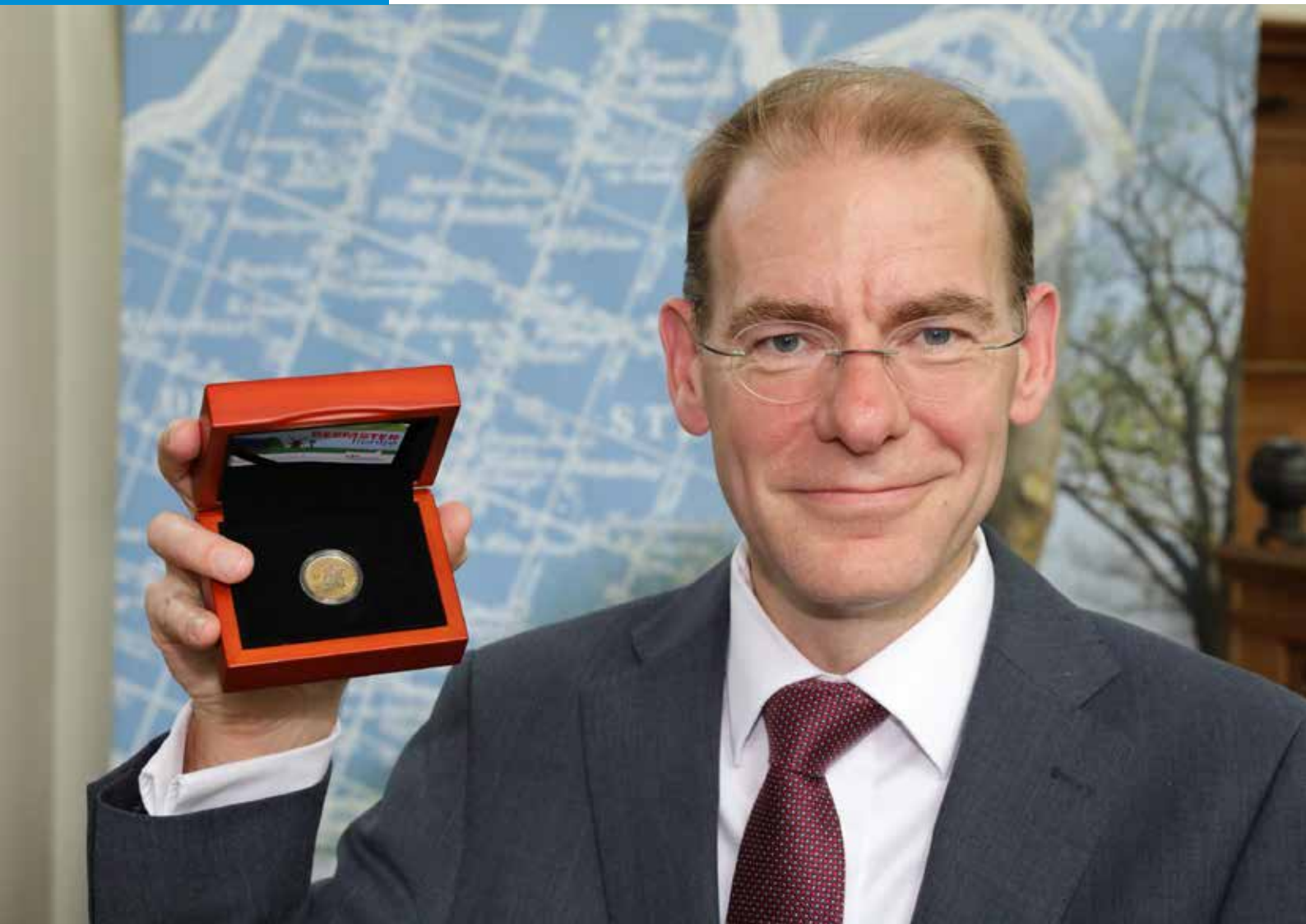
↑ Staatssecretaris van Financiën de heer Menno Snel

Droogmakerij de Beemster kreeg een herdenkingsmunt op 24 juni 2019. Door middel van een authentieke hamerslag verrichte staatssecretaris van Financiën, de heer Menno Snel, in de Keyserkerk te Middenbeemster de eerste slag. Het was de achtste uitgifte van de Koninklijke Nederlandse Munt (KNM) in de serie 'Nederlands Werelderfgoed'.