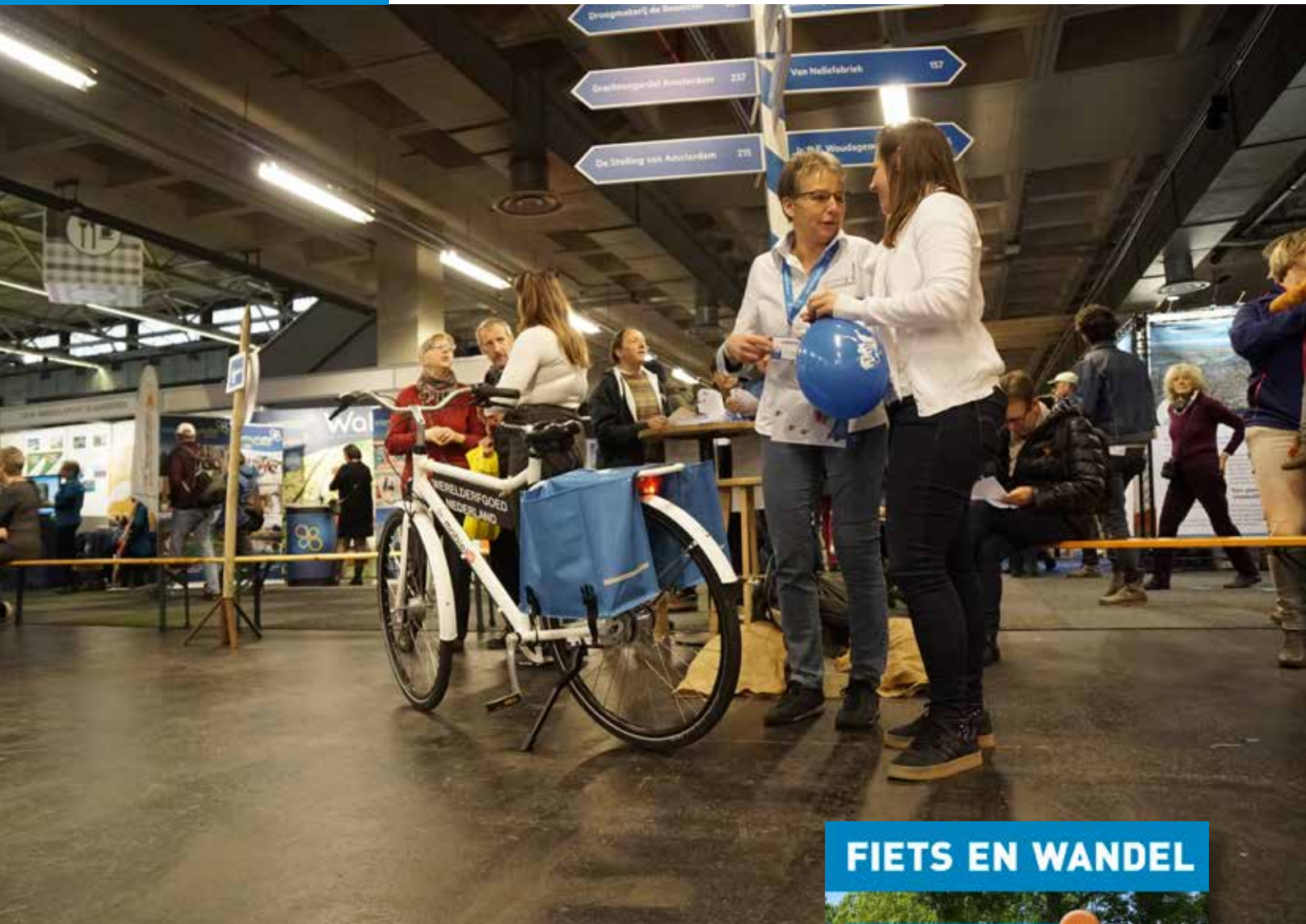
↑ Fiets en Wandelbeurs 2019

Eind 2019 is de start van het project UNESCO Werelderfgoed Fietsroute middels een positieve subsidiebeschikking mogelijk gemaakt. Een kleine projectgroep is direct aan de gang gegaan om de fietsroute te kunnen presenteren tijdens de Fiets en Wandelbeurs in Utrecht 2020.