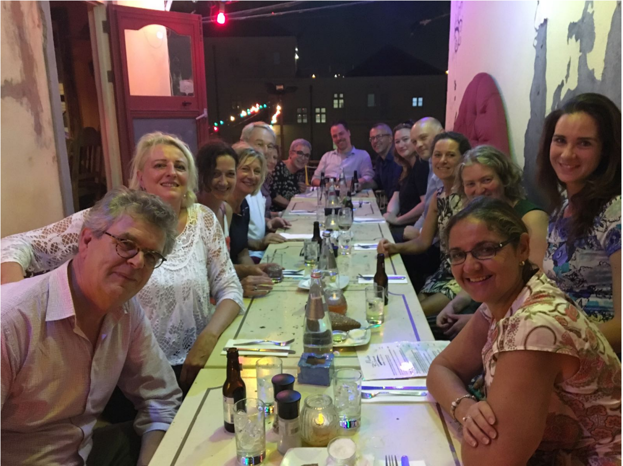
Dinsdag 21 november werd het werkbezoek afgerond met een excursie door de wijk Pietermaai. Heel gastvrij konden enkele monumenten ook van binnen worden bewonderd om