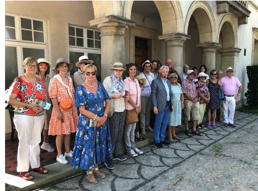
Visite guidée