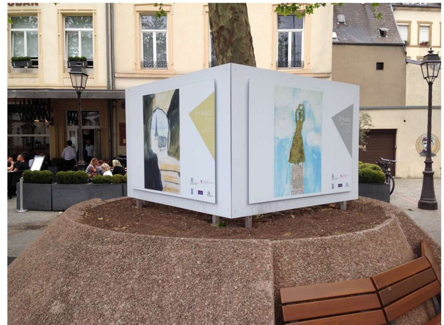
Exposition en plein air du concours de dessin « Luxembourg, vieux quartiers et fortifications