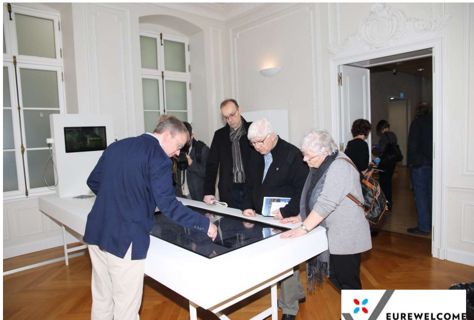
UNESCO Visitor Center

Sensibiliser les jeunes, les expats, les visiteurs