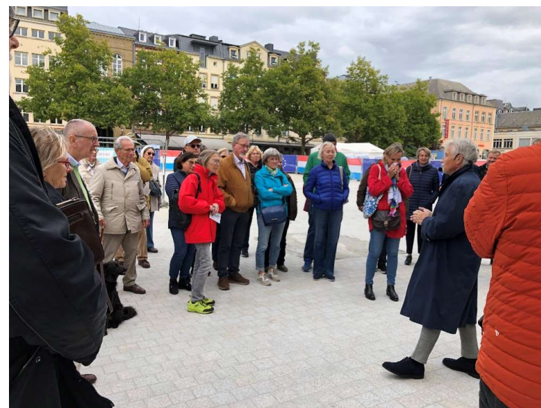
consultation citoyenne sur le terrain

Toutes les personnes intéressés, riverains, usagers, « stakeholders », etc. peuvent participer dans le cadre d'une démarche de « placemaking » à la conception de leur espace, présenter leurs idées et faire des propositions sur base desquelles, le Service Espace public, fêtes et marchés élabore, en concertation avec tous les services communaux voire partenaires étatiques, un premier projet qui sera présenté, discuté, adapté, ensemble, lors de réunions de participation citoyenne pour aboutir au projet final.