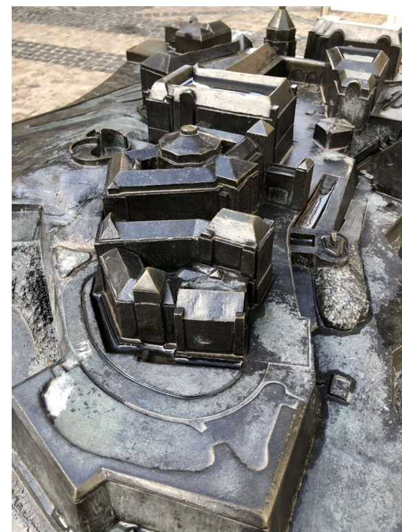
Maquette pour personnes mal voyantes